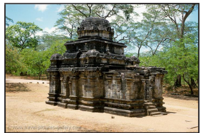
A රූපය (ලකුණු 04යි)