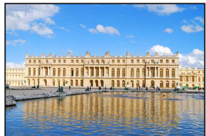
B රූපය (ලකුණු 04යි)